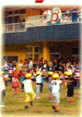
親子ふれあいの日