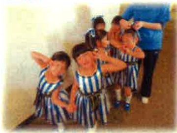
みゆき音楽とおゆうぎ会